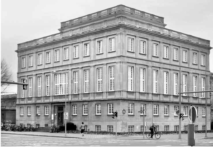
Wirtschaftswissenschaftliche Fakultät, Marschnerstraße 31 (Campus Jahnallee), 2008

für die neue Fakultät zu beachten ist, (ii) die Ordnungen für die neuen Studiengänge auszuarbeiten, (iii) für ein ordnungsgemäßes Studium Sorge zu tragen, (iv) bei Berufungs- und Graduerungsverfahren als Fakultätsrat zu wirken. 123