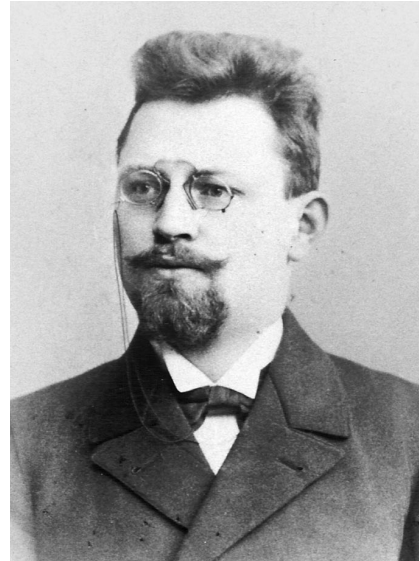
Eugen Schmalenbach (1873–1955)