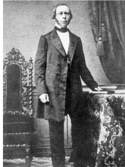
Wilhelm Roscher (1817–1894)

sich der angelsächsischen theoretischen Tradition und der popperschen Methodologie zu.“ 17 Tatsächlich macht die Beurteilung der Historischen Schule der Nationalökonomie in ihrer älteren und jüngeren Variante erst seit einigen Jahren eine Art Neubewertung durch, die im Kontext einer zu beobachtenden Rückbesinnung auf kulturökonomisches und institutionentheoretisches Wirtschaftsstilendenken steht und den Beitrag der Historischen Schule in Form ihrer evolutorisch systematischen Aufbereitung der Wirtschaftsgeschichte weniger kritisch betrachtet als in den Jahrzehnten zuvor. Dies mag dem über lange Zeit verbreiteten Negativimage der Historischen Schule entgegen wirken, den Anschluß an die internationale Theorieentwicklung, vor allem jene im angelsächsischen Sprachbereich, verhindert zu haben.