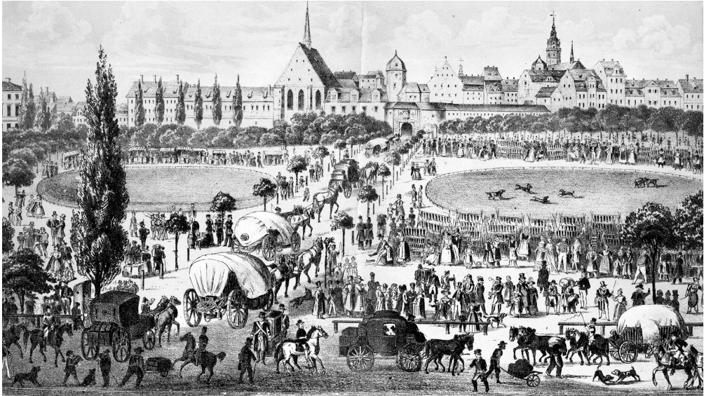
Messeverkehr vor dem Grimmaischen Tor, um 1850

vorliegt, sondern an den europäischen Hohen Schulen und Lehranstalten des Spätmittelalters bereits vermittelt wurde, auch wenn es noch weitgehend eingebettet blieb in Betrachtungen der theoretischen und praktischen Philosophie.