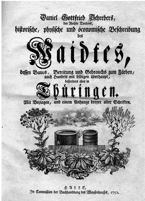
Daniel G. Schreber, Historische, physische und öconomische Beschreibung des Waidtes, Titelblatt, 1752

Schrebers freimütige Kritik richtete sich auf die ökonomische Situation in Sachsen aus und zeigte an Beispielen des Ackerbaus, Wiesenbaus, Obstbaus und an der Rinder- Schafs- und Seidenwürmerzucht die Nachteile, die für einen Staat entstehen, wenn die ökonomischen Wissenschaften an den Universitäten vernachlässigt würden. 10 Wie für die älteren Kameralwissenschaften typisch, ist hierbei die erwähnte enge Verbindung der Ökonomie zu den landwirtschaftlichen Disziplinen auffällig. Bereits im Jahre 1752 hatte Schreber in seinem Buch „Historische, physische und öconomische Beschreibung des Waidtes“ eine Wiederbelebung des Waidanbaus gefordert. Die Färberpflanze Waid war als kultivierte Feldpflanze vor allem in Thüringen angebaut worden und ab ca. 1500 nahezu vollständig durch indische Importe eines Farbstoffes verdrängt worden, der aus der Indigopflanze gewon-