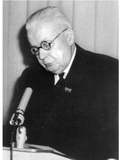
Felix Burkhardt (1888–1973)

Etliche von Burkhardts Absolventen nahmen entweder verantwortungsvolle berufliche Positionen ein oder wurden selbst Hochschullehrer mit maßgeblicher Beteiligung an der Entwicklung der DDR-Statistik. Sein letzter Promovend zeichnete über den Zusammenbruch der DDR hinaus bis zu seinem Ruhestand im Jahre 2005 für die Statistik-Ausbildung an der Wirtschaftswissenschaftlichen Fakultät verantwortlich. 110